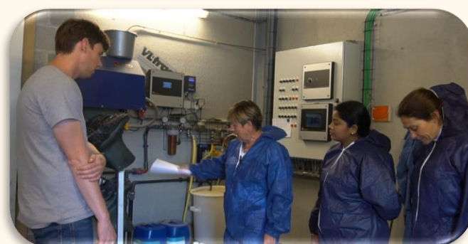
Figuur 4. Eerste beoordeling van het bedrijf en verzameling van gegevens vóór de coaching