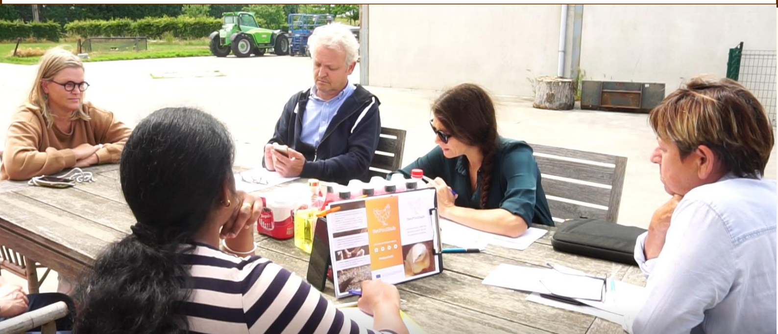
Figuur 2. De coach, de facilitator, de dierenarts en de vleeskuikenhouder tijdens een coachingsessie. Coaching is de geselecteerde ondersteunende maatregel voor België in NETPOULSAFE.