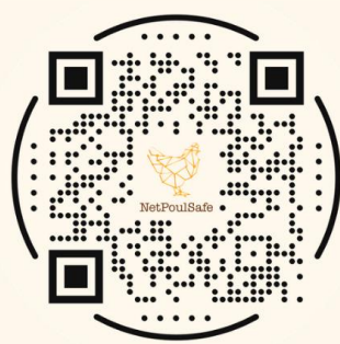
De Biocheck.Ugent tool